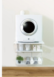
ガス衣類乾燥機 「乾太くん」専用台