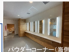
パウダーコーナー（海側）

所在地：大阪府泉大津市なぎさ町 施工：阪神高速技術株式会社 竣工：2024年4月26日