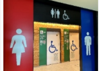
トイレエントランス（陸側）