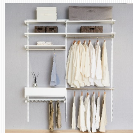
パーツは自由自在に 組み合わせが可能です

ガス衣類乾燥機「乾太くん」全シリーズ（リンナイ（株））に対応した専用台は、落下防止ストッパー付きで乾燥時の乾太くんの振動にも安心の仕様です。