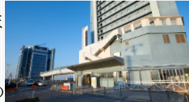
泉大津PA外観 （左：海側、右：陸側）

また、パウダーコーナーの壁面には、パネ協の不燃化粧板「アーバンス 麻の葉柄」をご採用いただきました。アーバンスは、ケイカル板を加工した国土交通大臣認定の内装用不燃化粧板で、陶器のようになめらかな質感が特徴です。