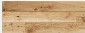
不燃天井NEO(ナラ/節あり)

所在地:愛知県刈谷市小垣江町 設計:中日設計株式会社 施工:徳倉建設株式会社 竣工:2024年8月