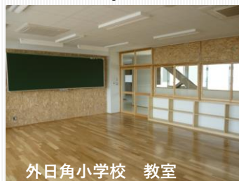
外日角小学校 教室

教室・廊下の壁はOSB合板(サンダー掛け)910 x 3000を設計事務所に提案し、縦ジョイント無しの仕上がりが見込まれました。