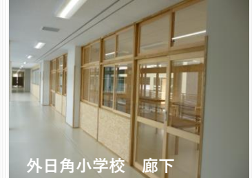
外日角小学校 廊下