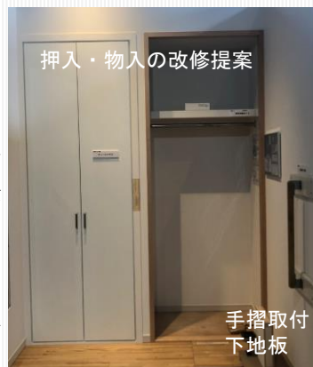
押入・物入の改修提案

また、床の段差を解消できるフローリングや壁に補強がなくても手摺を取付けられる手摺取付下地板等を展示しています。